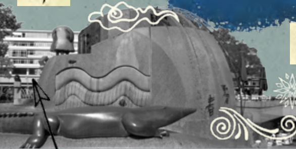
Das „Bikini Berlin“